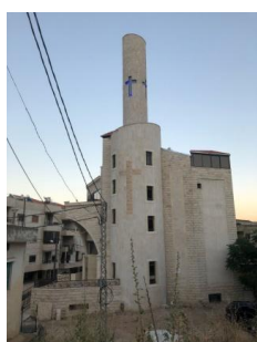
Kirche in Zahlé

Die Nöte dort sind groß, weil viele Menschen kein Geld haben um eine Arztbehandlung zu bezahlen. Die Kirchengemeinde hat die Vision eines ganzheitlichen Dienstes und stellt Räume für diese wichtigen Einsätze an den Kranken zur Verfügung. Wir arbeiten in den Strukturen unserer Partnergemeinde. Die Bilder geben einen kleinen Einblick.