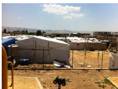
Einblick in ein Flüchtlingscamp