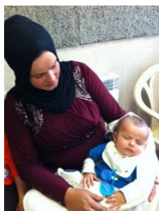
Mütter mit kranken Kindern, die meisten sind Muslime