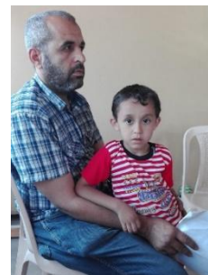
Vater mit krankem Sohn

Wir brauchen Ärzte mit Berufserfahrung m/w die gerne in einem Team arbeiten in folgenden Disziplinen: