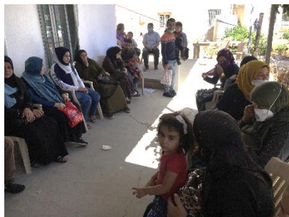
Warten im Freien