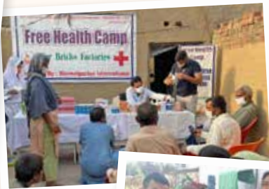
Pakistan Medizinisches Camp