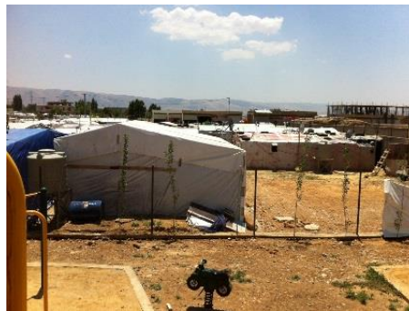
Einblick in die Zeltdörfer