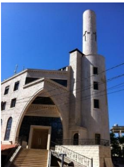
Kirche in Zahle

Die Bilder machen etwas davon deutlich und geben einen kleinen Einblick.