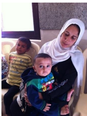
Mütter mit kranken Kindern, die meisten sind Muslime