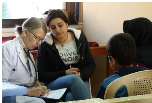
Ärztin bei der Arbeit