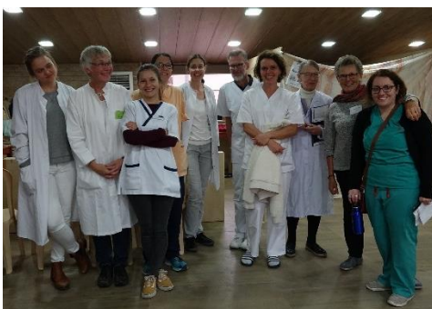
Medical Care Team