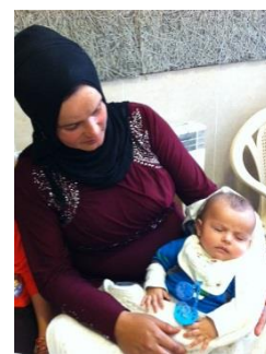
Mutter mit krankem Kind