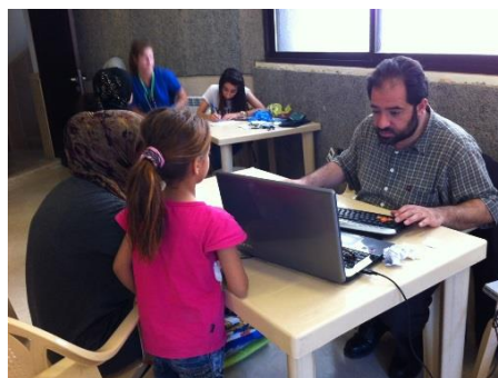
Registrierung der Patientenendaten